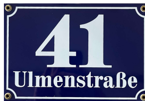
Abb.: Muster Hausnummerntafel Marktgemeinde Rum

Bei den oben angeführten Punkten handelt es sich nur um einen Auszug der Bestimmungen aus der TBO und der TBV, selbstverständlich sind alle gesetzlichen Festlegungen einzuhalten.