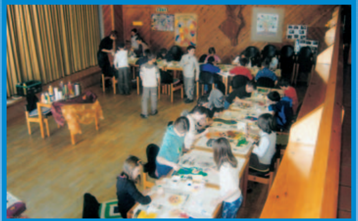
Schüler beim Gestalten von Lesezeichen