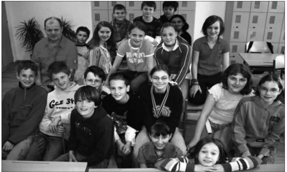
1. Klasse/HS Rum

Weiter „Sagen“ von Schülern, gibt es in der nächsten Ausgabe des Rum Journals.